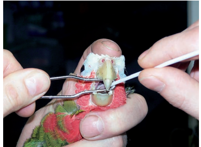
Abstrich von der Lidbindehaut (links) und Tupferprobe aus dem Kropf (rechts) einer Kuba-Amazona ( Amazona leucocephala )

werden. Vor Betreten der Quarantäne-station ist eigens für diesen Raum vorge-sehene Kleidung (z. B. ein Kittel) anzule-gen. Außerdem sollte das Schuhwerk gewechselt oder zumindest desinfiziert werden. Möglich sind auch Einmalüber-zieher. Die Hände sind vor Betreten und – noch wichtiger – nach Verlassen des Quarantänerraums zu waschen und zu desinfizieren.